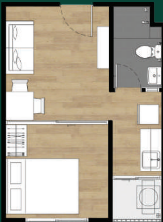
1A 1 BED 25.57 sq.m.