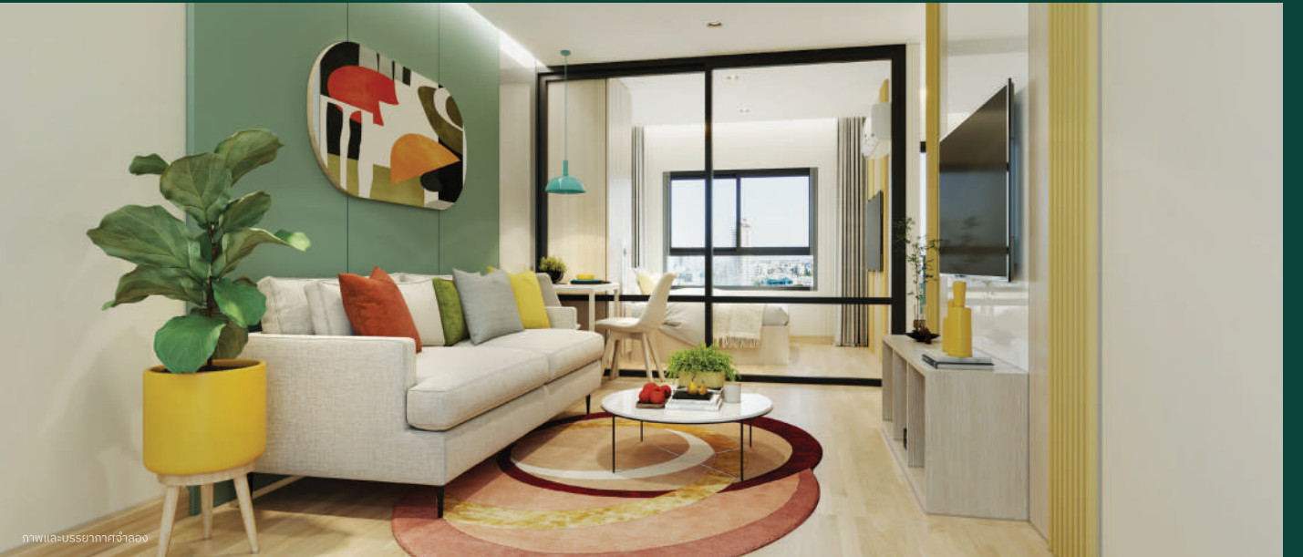
ภาพและบรรยากาศจำลอง

ชื่อโครงการ: โพนี คอนโด รังสิตสเตชัน สถานที่ตั้ง: ถ.เลียบคลองเปรมประชากร (ช.เวิร์คพอยท์ สตูดิโอ) ต.บางพูน อ.เมืองปทุมธานี จ.ปทุมธานี ประเภทที่พักอาศัย: คอนโด Low Rise 5 ชั้น จำนวน 79 ห้อง เจ้าของโครงการ: บ.จักรไพศาล เอสเตท จำกัด (มหาชน) ผู้พัฒนา อสังหาริมทรัพย์มากกว่า 25 ปี ที่จอดรถ: ประมาณ 56% (รวมซ้อนคัน)