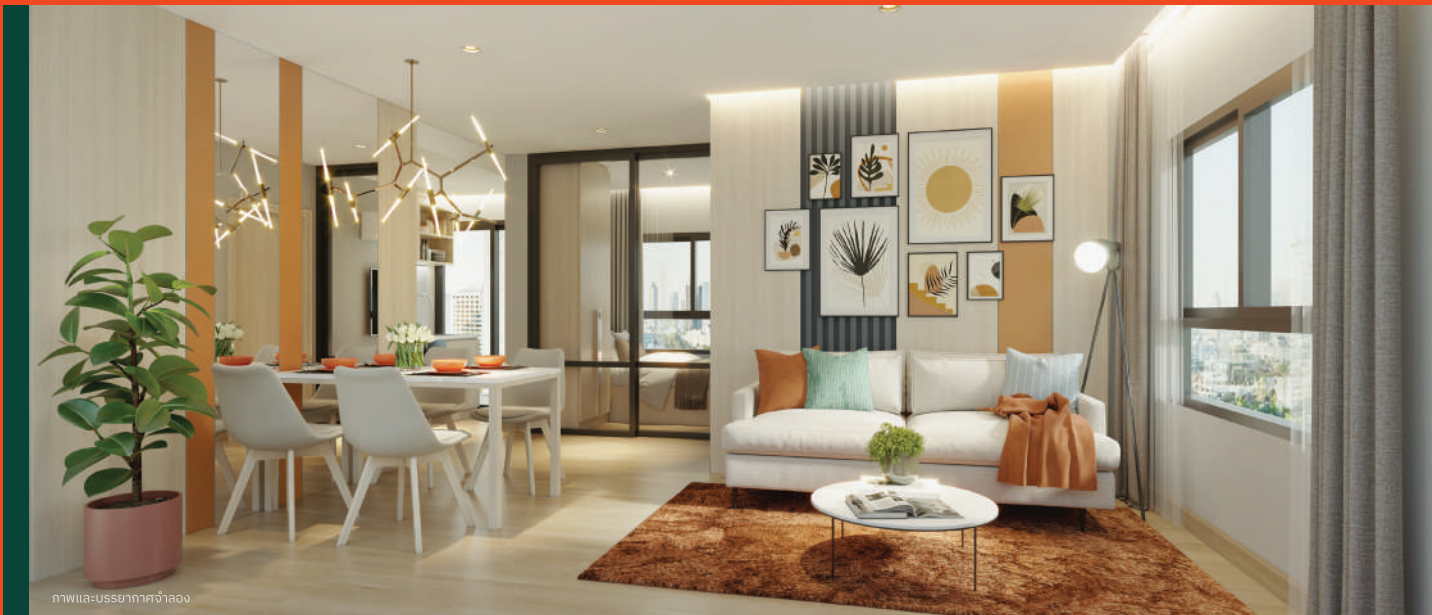
ภาพและบรรยากาศจำลอง

อิสระท่ามกลางธรรมชาติ เพียง 79 ห้อง ให้คุณสัมผัสถึงความสงบ อยู่ในพื้นที่ อากาศบริสุทธิ์ มาพร้อมกับความสะดวกสบายในการเดินทางทำเลศักยภาพ ใกล้รถไฟฟ้า ทางยกระดับอุตราภิมุขและสนามบินดอนเมือง