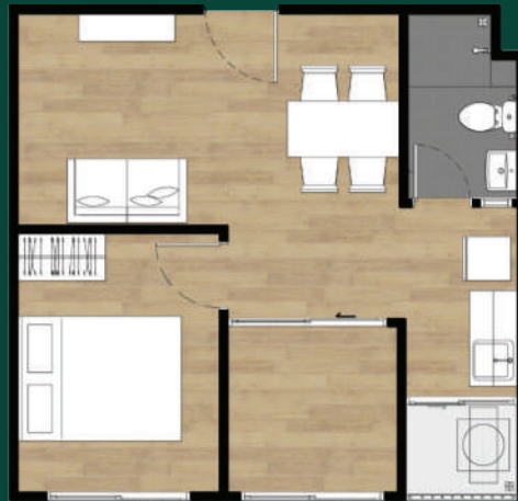
1B 1 BED PLUS 36.27 sq.m.